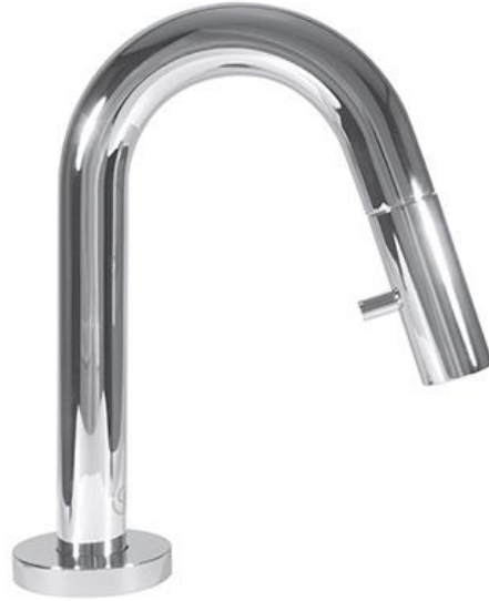
Ideal Standard Koudwaterkraan 6 l/min met hoge uitloop en geïntegreerde bediening in chrom