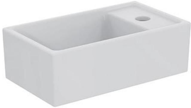
Ideal Standard Fontein 37cm x 21 cm met kraangat rechts, wit