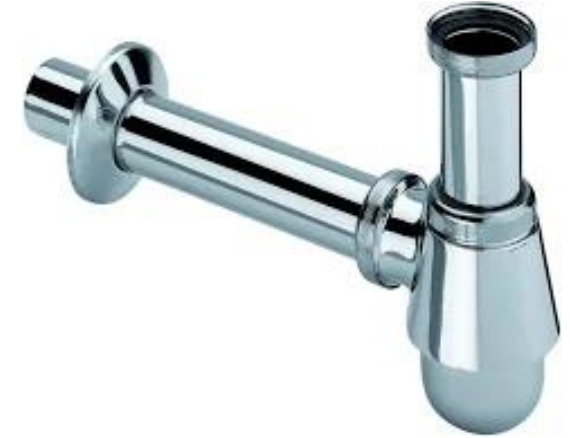
Viega Plugbekersifon met muurbuis en rozet, chrom