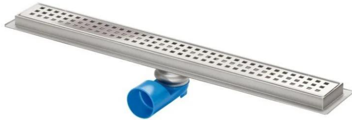
Douchegoot met RVS lengte 70 cm